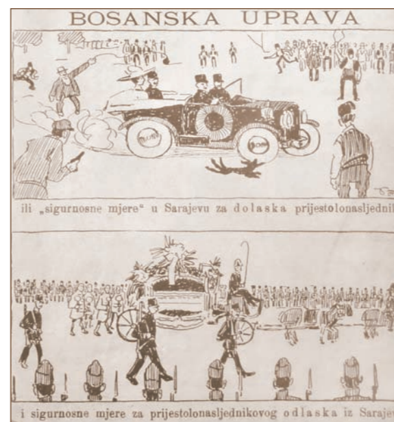
Die bosnische Verwaltung und ihre „Sicherheitsmaßnahmen“ in Sarajevo bei der Ankunft des Thronfolgers sowie ihre Sicherheitsmaßnahmen bei der „Abreise“ des Thronfolgers. (Zeichnung von Roman Petrović)

Kommen wir nun kurz auf die auf die Ereignisse am St. Veitstag des Jahres 1914 zurück. Die nicht zu verleugnende Unverhältnismäßigkeit zwischen den Sicherheitsmaßnahmen am Tag des Attentats und denjenigen bei der Überführung der Ermordeten aus Sarajevo löste zahlreiche Spekulationen aus dem Bereich von Verschwörungstheorien aus. Unter anderem inspirierte diese Ungereimtheit auch den Sarajevoer Maler Roman Petrović zur folgenden ironischen Darstellung: