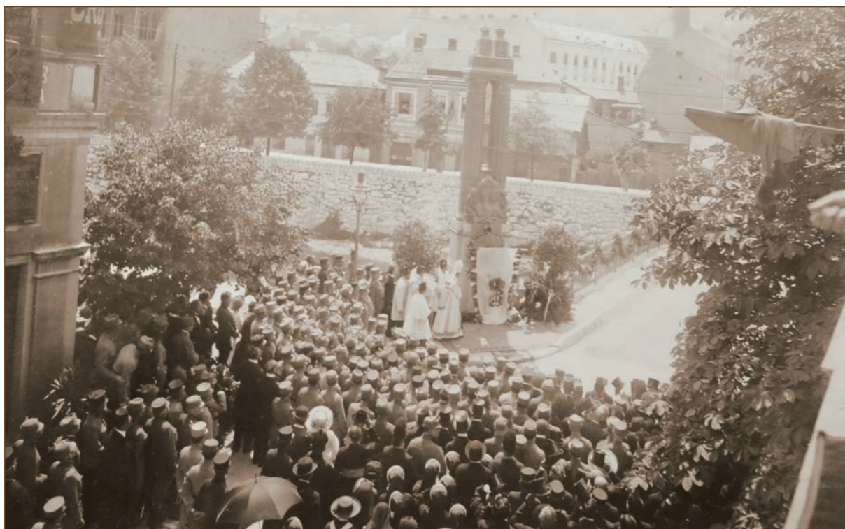
Einweihung des Denkmals

Verkehrseinschränkungen in der weiteren Zone der Lateinerbrücke in Kraft. Um 10.30h blockierte die Gendarmerie den Zutritt zur Zone, in welcher die Feierlichkeiten abgehalten wurden. In dieser Zone konnten sich nur die Personen aufhalten, die weiße Karten oder spezielle Passierscheine hatten (höchste Funktionäre, hohe Gäste und Amtspersonen). Die weißen Karten waren mit den Buchstaben A, B, C, D, E, F und G gekennzeichnet. Auf der Franz-Josephs-Straße konnten nur Personen mit