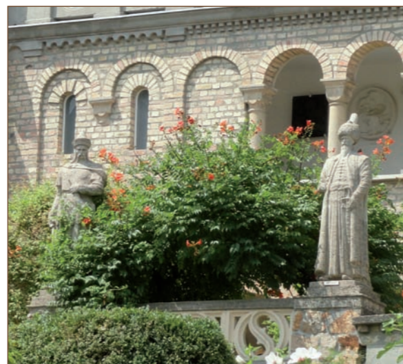
Denkmal für Nikola Zrinski und Süleyman in Bory-vár

des Komplexes Bory-vár steht nämlich ein Denkmal für zwei unversöhnliche Feinde, Nikola Šubić Zrinski und Sultan Süleyman den Prächtigen, die Protagonisten der Schlacht bei Szigetvár. Auch bei Szigetvár steht ein imposantes Denkmal für Zrinski und Süleyman.