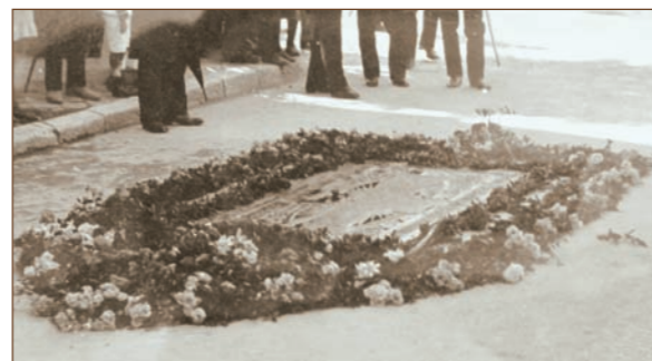
Eisentafel am Attentatsort

FRANCISCUS FERDINANDUS - SOPHIA DE HOHENBERG