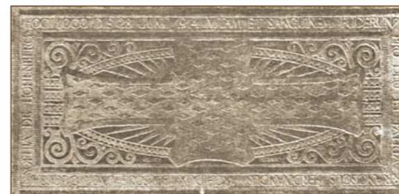
Aussehen der Tafel

HOC LOCO DIE 28. JUNII 1914. VITAM ET SANGUINEM FUDERUNT PRO DEO ET PATRIA FRANCISCUS FERDINANDUS ARCHIDUX EJUSQUE UXOR DUCISSA SOPHIA DE HOHENBERG. (AN DIESEM ORT GABEN AM 28. JUNI 1914 IHR LEBEN UND IHR BLUT FÜR DAS VATERLAND DER ERZHERZOG FRANZ FERDINAND UND SEINE GATTIN HER- ZOGIN SOPHIE VON HOHENBERG).